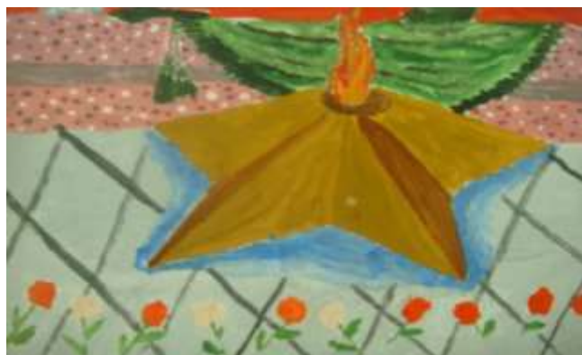
(рис. Басова Кристина)

Мы все живём в счастливое время И не знаем горя войны, Голода, слез, боли потери... К счастью, мы без них рождены. Мы не слышали свиста над домом, Где живёт простая семья, И я счастлива, что мы не знакомы С плачем мальчика, потерявшего мать. Все люди просили о помощи, Взывали они к небесам И доверили защищать нашу Родину Братьям, отцам, сыновьям и дедам. Они шли на войну, зная цену жизни, Но волновало их только одно: Дома их будут ждать семьи, Но дожидаться не всем им будет дано... И вот наступил конец горю, Люди радовались как никогда, Торжествуя, все ликовали: "Победа! Победа! Ура!"